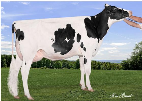
JOSEY-LLC UNO SANGARIA FOURTH DAM