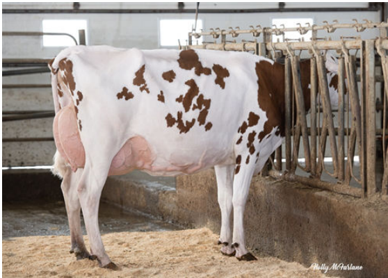
VOGUE MIRAND RED WINE-PP DAM