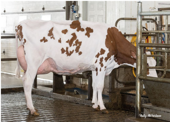
VOGUE MIRAND RED WINE-PP DAM